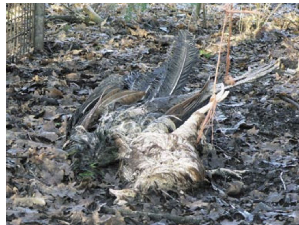
De vangkooi voor vossen met een dode fazant en dode kip als lokaas.