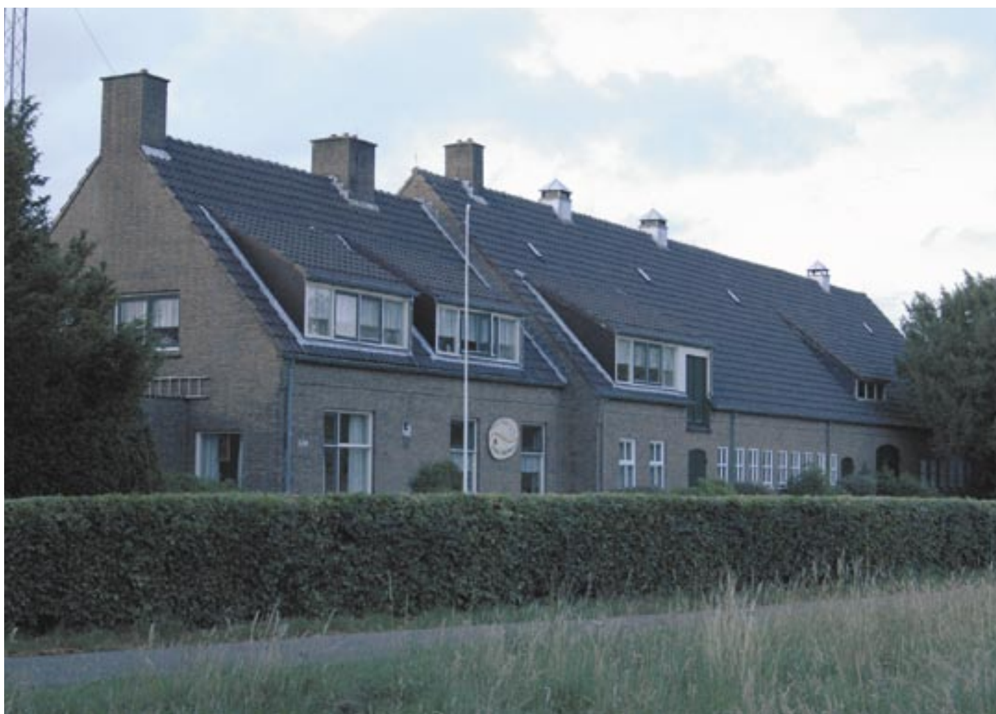
De “Mariahoeve”, het bezinningscentrum van de paters van Don Bosco in Assel, gemeente Apeldoorn.

“Midden in een schitterend natuurgebied krijg je er alle ruimte om even uit de sleur en stress van school, studie en werk te stappen. ‘In de middle of nowhere’ kun je letterlijk ‘afstand nemen’ van je dagelijkse beslommeringen. Je komt tot rust en je kunt samen iets doen aan de ontwikkeling van jezelf en van je groep.”