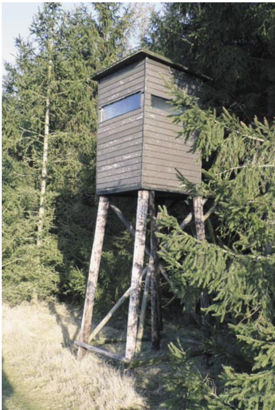
Eén van de vier jachthutten op het terrein van Don Bosco.

De rondgang over het terrein leverde echter nog meer opmerkelijke feiten op over activiteiten, die je niet vanzelfsprekend zou verwachten bij een bezinningsoord. Zo werd er bij één van de vele gaten in de omheining rond het terrein een druk gebruikte voederplaats voor herten aangetroffen. Zelfs werd er in een hoek van het terrein een heuse vangkooi voor vossen gevonden. Als “lok”-voer waren in de kooi een dode fazant en een dode kip opgehangen. Los van de ethische vraag of het ophangen van dode dieren